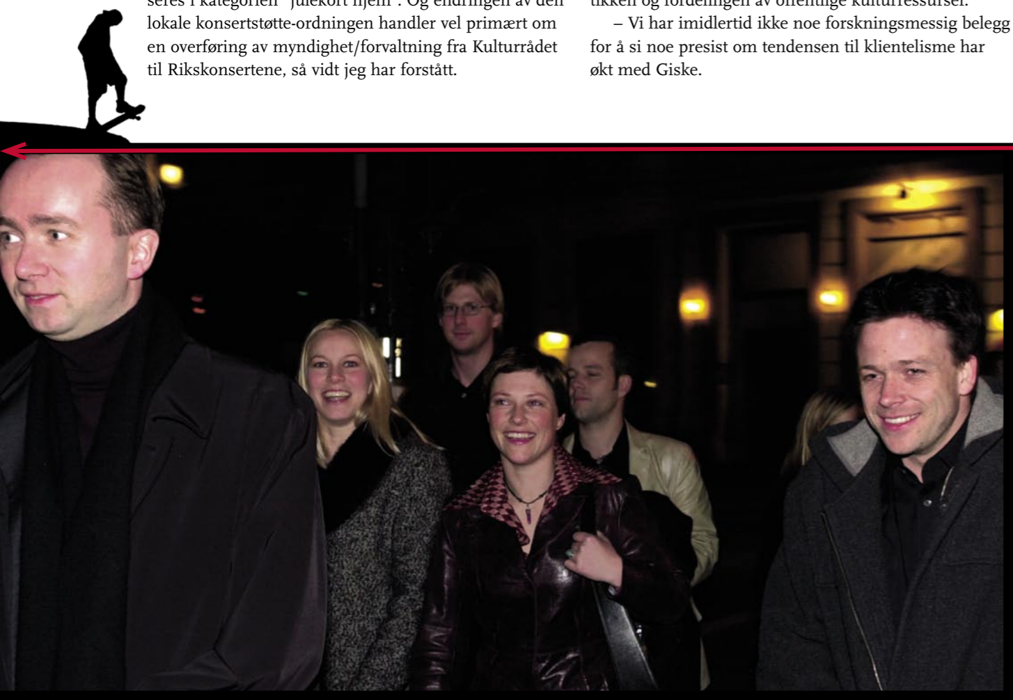
Giske og vennene: I større grad enn sine forgjengere omgir Trond Giske seg med et uformelt nettverk av rådgivere og venner. Her sammen med bl.a. prinsesse Märtha Louise, Ari Behn og Kåre Conradi.

– “Fyrsten”, altså Lang, hadde en tendens til å omgi seg med en nær krets av uformelle rådgivere og “venner”. De har mer å si for kulturpolitikken retning og utforming enn det formelle statsbyråkratiet og interesseorganisasjonene har. Kanskje peker også Giskes kulturpolitiske stil, som Langs, likevel i noen grad i klientelistisk retning?